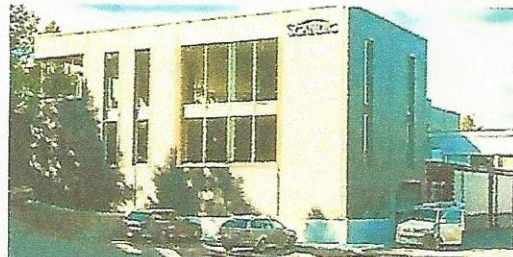
Scandic Markiser hovedkontor og fabrikk Gjøvik